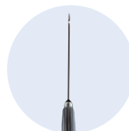
Ambix Safe-Can® Gerade