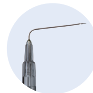
Ambix Safe-Can® 90 Grad gebogen